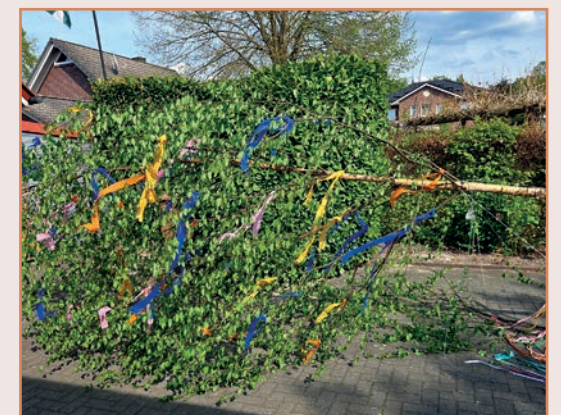
Maibaum setzen 2026