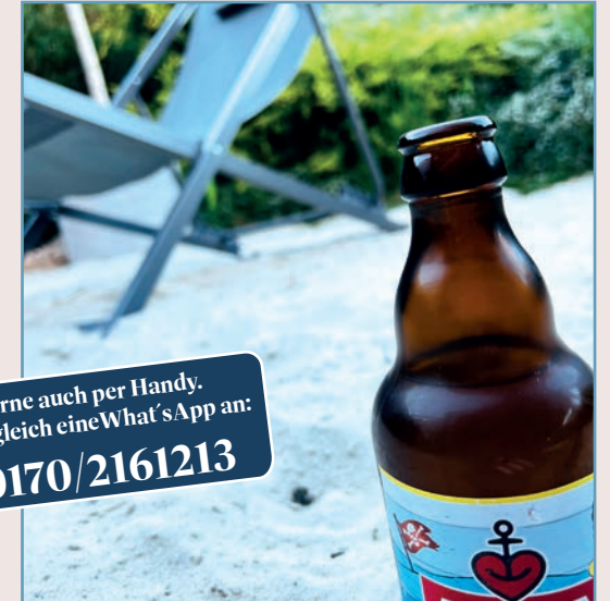
Auszeit im Liegestuhl

Gerne auch per Handy. ...gleich eine What's App an: 0170/2161213