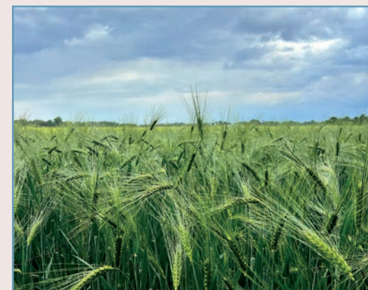
Ziemlich frisch unterwegs ...